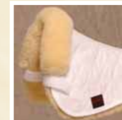
12 weiß/natur white/natural