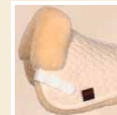
22 beige/natur beige/natural