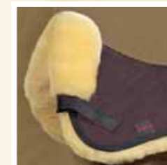
72 braun/natur brown/natural