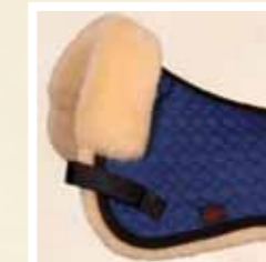
52 blau/natur blue/natural