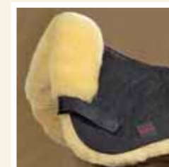
62 schwarz/natur black/natural